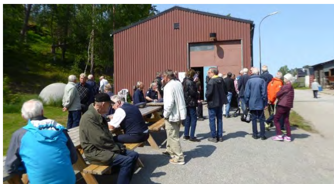
Indelning i grupper

Vi fick guidad rundvandring på basen och i Radiomuséet – Motorverkstaden – Museet