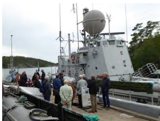
Samling vid Spica