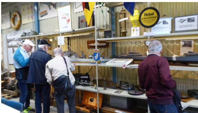
Det finns många fartygsmodeller på hyllorna

Motortorpedbåtarna låg på land vilket möjliggjorde studium av bottenkonstruktionerna med V-botten och stegbotten mm.