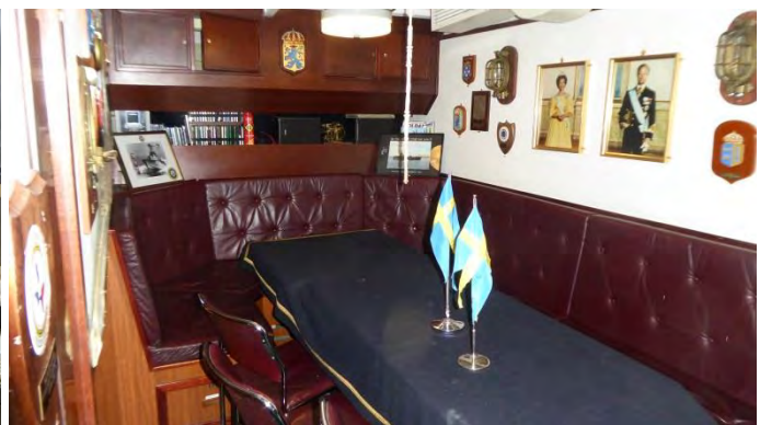
Officersmässan. Bordet används för behandling av sårade sjömän vid strid