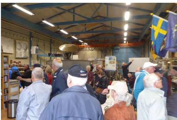
Många intressanta föremål i muséet