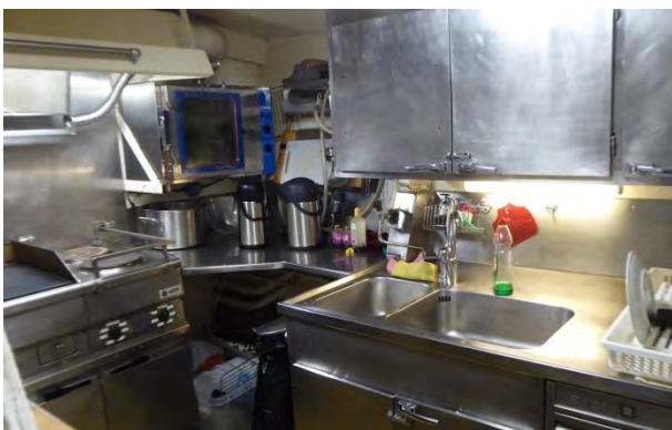
Byssan - "köket" - allt rostfritt