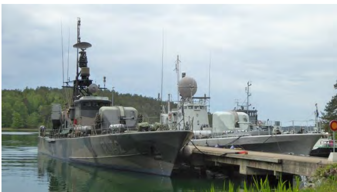
R 142 Ystad och T 121 Spica

Besöket fortsatte till torpedbåtspirarna.