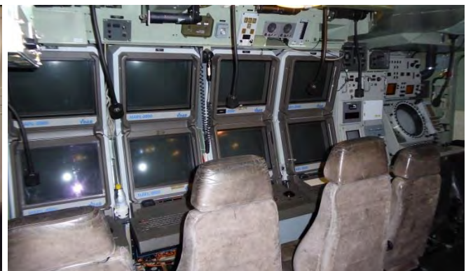
Stridsledningscentralen, SLC, här leds striden