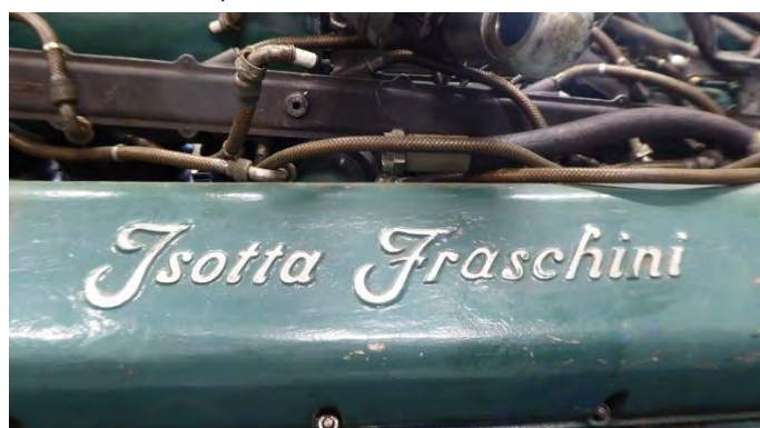
Ursprungligen Italiensk flygmotor, 1.500 hkr, drivs med 100 oktanic flygbensin, tre motorer i varje torpedbåt