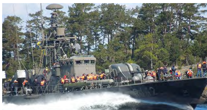
T 142 Ystad här ombyggd till R 142 som fick de aktra fyra torpedtuberna bytta till Robot 15. Byggd 1976, i tjänst 1976–2005, K-märkt 2018