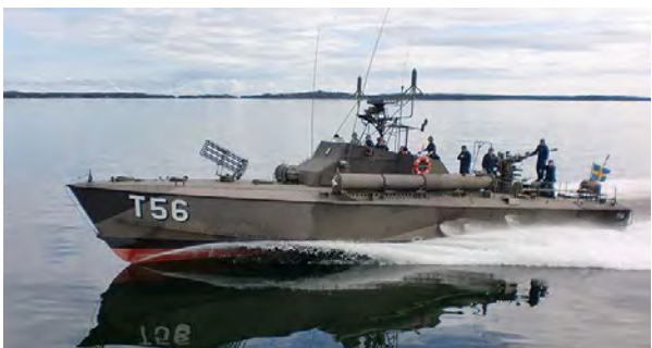
T 56, i tjänst 1957–1973, K-märkt 2006