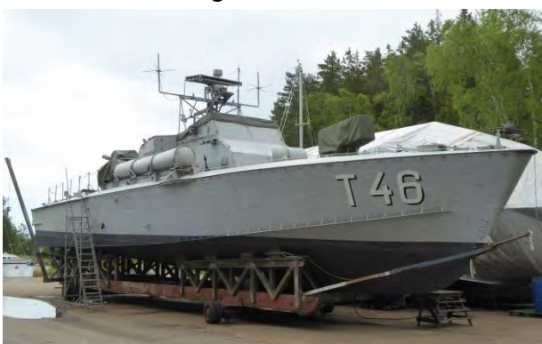
T 46 ägs av HM Konungen

Motortorpedbåtarna låg på land vilket möjliggjorde studium av bottenkonstruktionerna med V-botten och stegbotten mm.