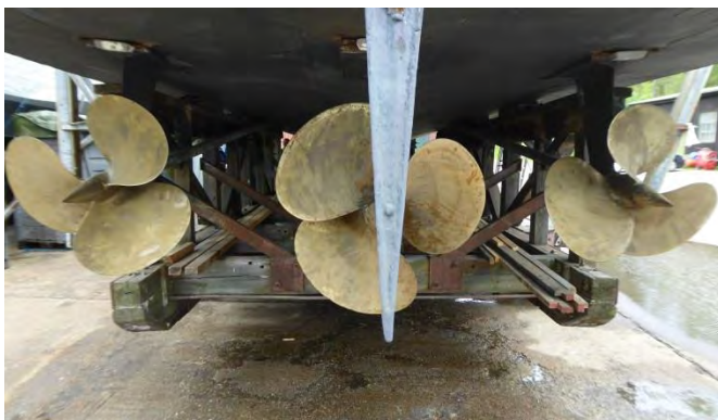
Kraften ut genom propellrarna ger ca 50 knop