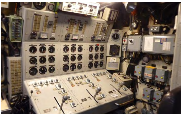
Maskincentralen, här styrs turbinerna