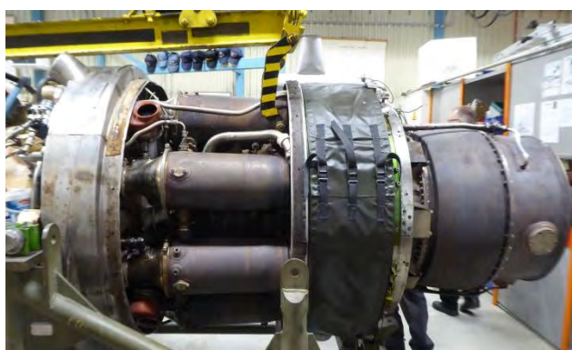
Motorverkstaden, gasturbin till Spica – Ystad 4.250 hkr, drar ca 1.000 L/h diesel i fullfart