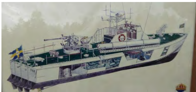
Ett kraftpaket maskinellt och i bestyckning

Besöket fortsatte till torpedbåtspirarna.