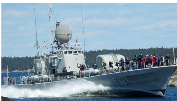
T 121 Spica med tre gasturbiner på sammanlagt 12.750 hkr. Byggd 1966, i tjänst 1966–1989, K-märkt 2005

FMV Veteranklubb planerar att återkomma med inbjudan till fler utfärder under nästa år.