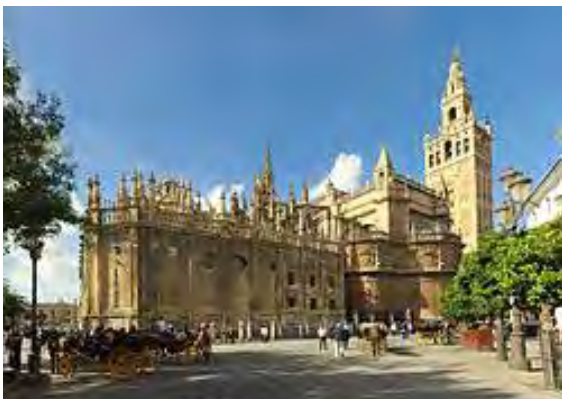
Katedralen är världens största. Byggdes mellan 1402 och slutet av 1500-talet. Christopher Columbus är begravd här

Sevilla är Spaniens fjärde största stad. Kända byggnadsverk är katedralen och palatset Alcázar.