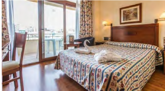
Bra rum men mindre välordnad matsal