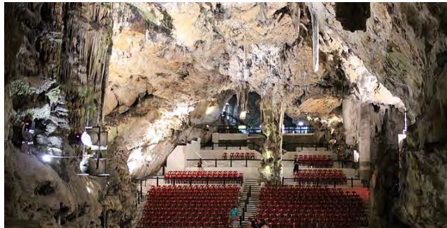
Grottorna med den stora konsertlokalen

I Gibraltar centrum hade vi egen tid för rundvandring.