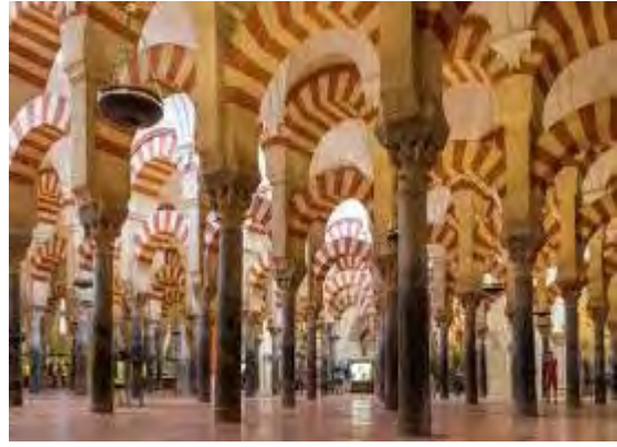
Moskéinteriören är till största delen kvar

Efter besöket åkte vi vidare de 14 milen till Sevilla där vi tog in på Hotell Zenit Sevilla som vi bodde på i 3 nätter.