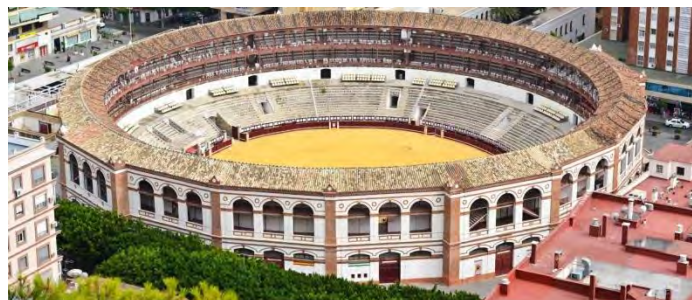
Rondas tjurfäktning Plaza de Toros är en av de äldsta i Spanien från 1785