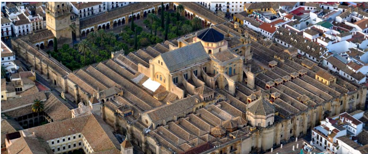
Moske – Katedralen La Mezquita i Cordoba (180 x 130 meter)

Vi besökte den stora katedralen La Mezquita som ursprungligen byggdes som moské och är ett av den islamiska arkitekturens främsta byggnadsverk.