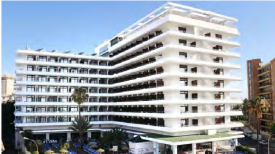
Hotell Gran Cervantes

Därefter fortsatte vi färden till Torremolinos som ligger nere vid Medelhavet nära Malaga. Vi tog in på hotell Gran Cervantes för att bo där i 2 nätter. Middag på kvällen.