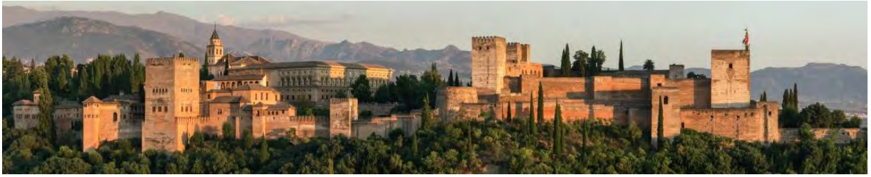
Alhambra, morenas sista fäste i Spanien, byggt på en hög klippa ovanför Granada