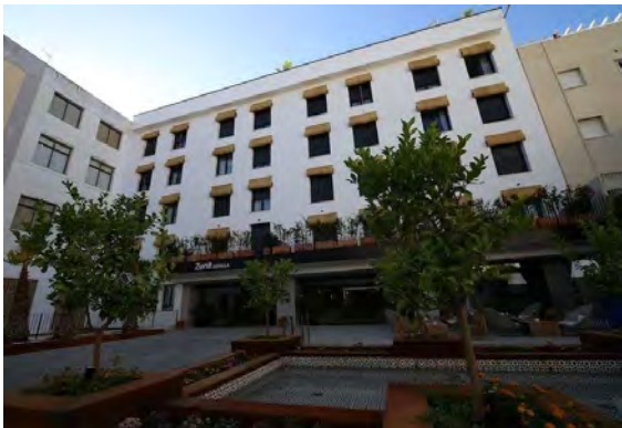
Hotell Zenit Sevilla