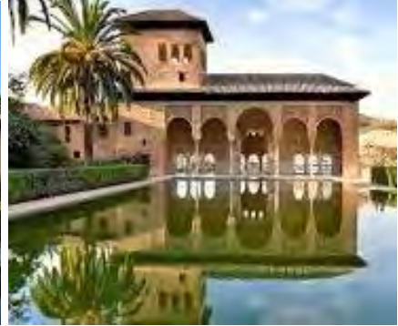
Alhambra inrymmer många palats, trädgårdar och vattenspeglar