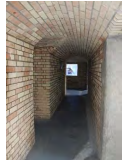
Europa Point - Hardings Batteri med 32 cm kanon - kunde skjuta till Gibraltar Sund.

Vi besökte sedan Saint Michael's Cave och grottorna med den stora konsertlokalen