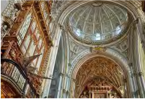
Katedralen står mitt i den tidigare moskén