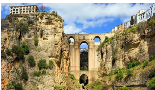
Bron över ravinen som delar Ronda

Därefter besökte vi Bodega Garcia Hidalgo. Där fick vi en rundvisning och vinprovning av 3 olika viner och snacks.