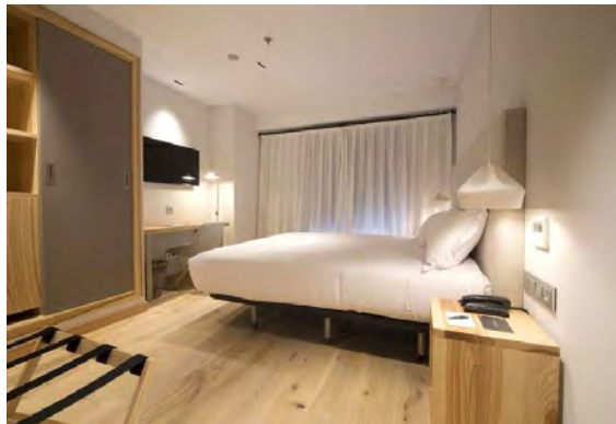
Vi bodde bra också på detta hotell