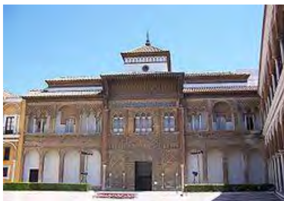
Alcázar är ett kungligt palats som ursprungligen var ett moriskt fort