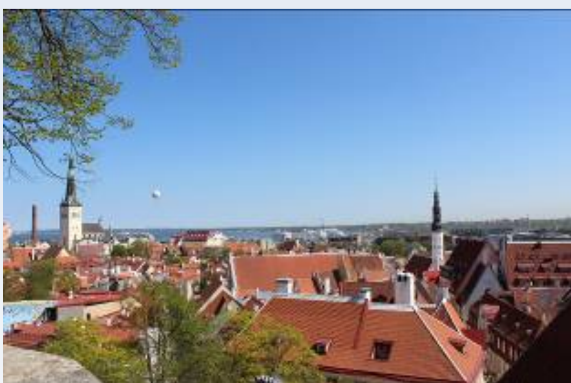
Utsikt från Domberget

Då vi kommit fram på morgonen gjordes en bussrundtur först till Tallinns ytterområden, bland annat Kadriorg och sångarfältet och sedan in till Domberget där det blev promenad i innerstaden. Lunchen serverades på den välbekanta krogen Olde Hansa.