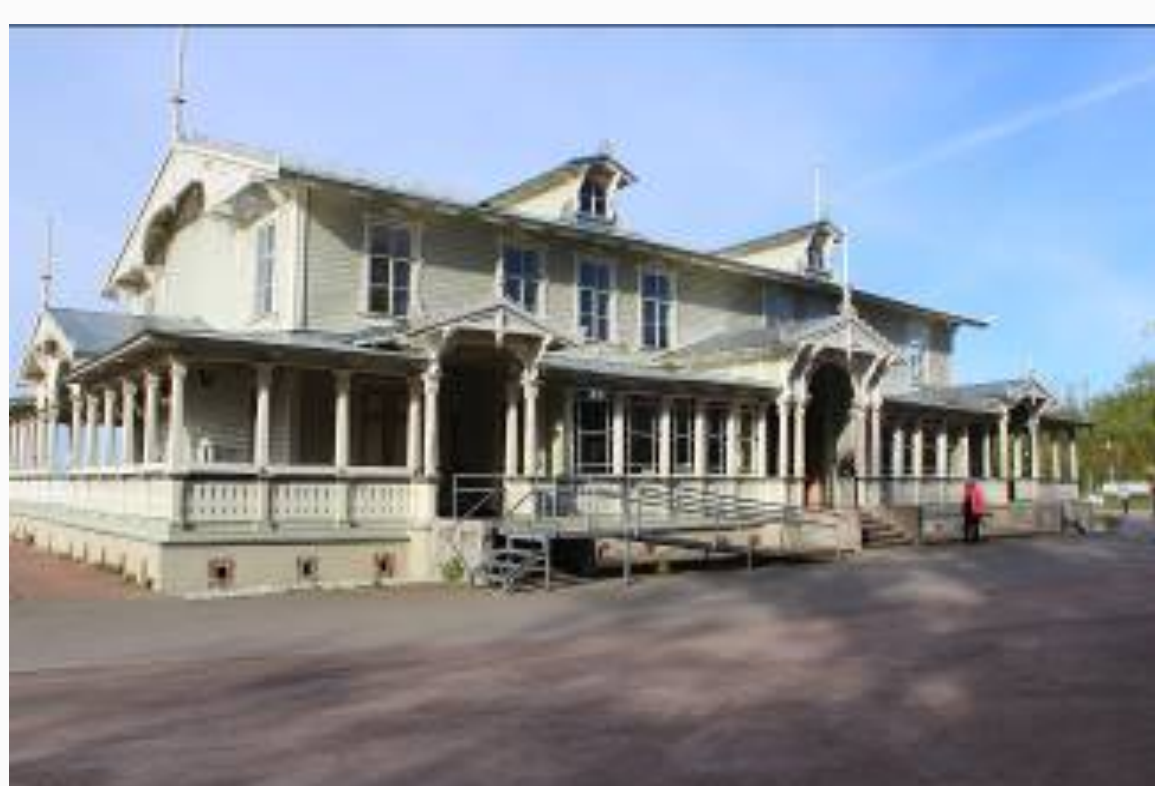
Kurhotellet i Haapsalu

På hemvägen stannar vi till i staden Haapsalu, där vi gjorde en kort rundtur före middagen på den trevliga puben Lilla Taks. Sedan färd tillbaka till Tallinn.