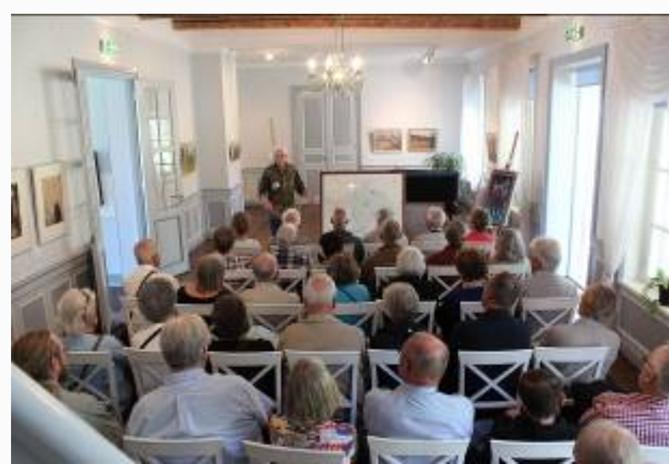
Historiska museét i Kärdla

På hemvägen stannar vi till i staden Haapsalu, där vi gjorde en kort rundtur före middagen på den trevliga puben Lilla Taks. Sedan färd tillbaka till Tallinn.