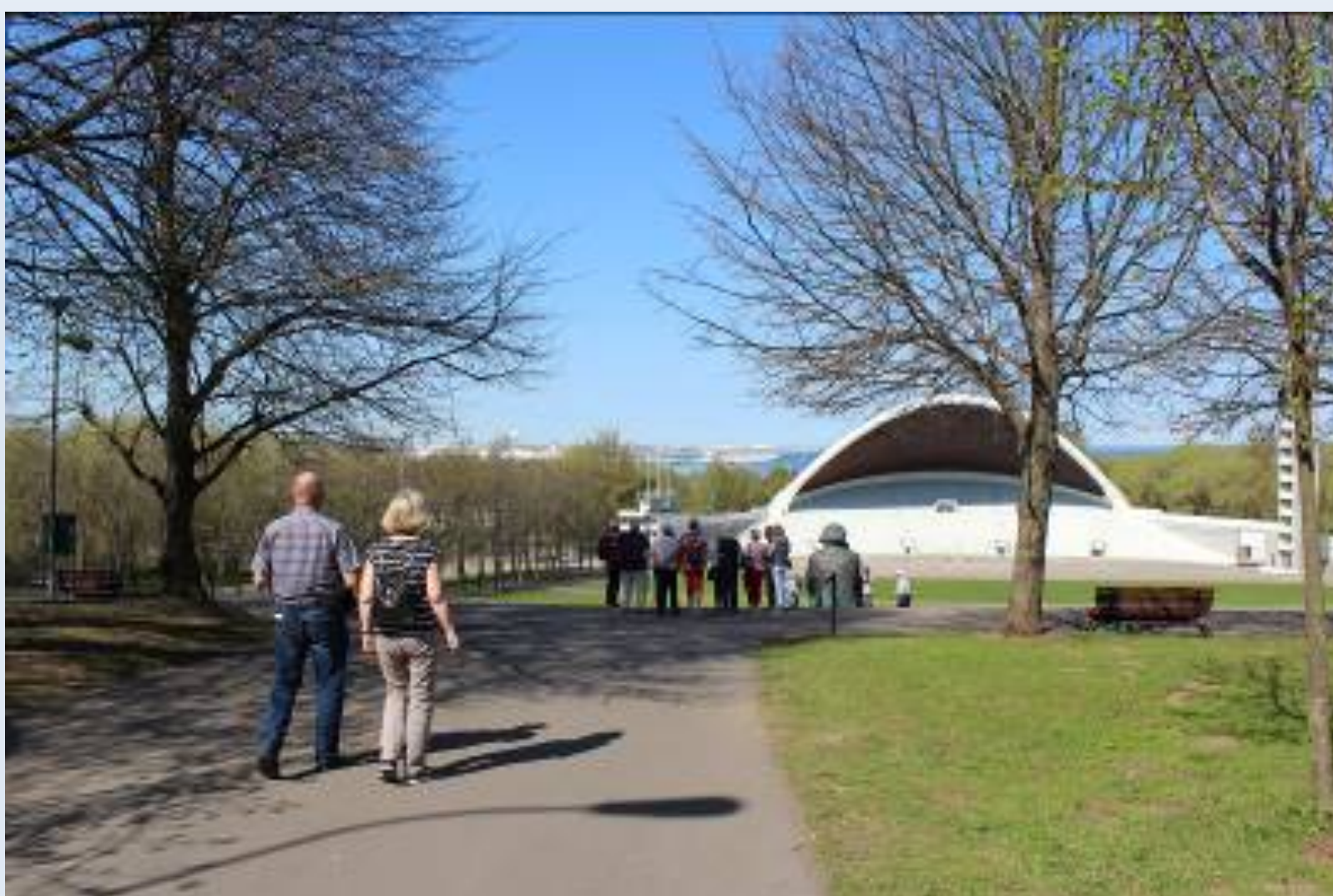
Sångarfältet där de återkommande sångfesterna hålls

Första dagen åkte vi på em med Tallinks fartyg Victoria till Tallinn som skulle bli bas för resan med två övernattnings på Tallink City Hotel.