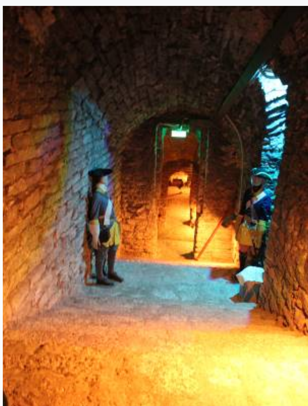
Interiör från bastionerna

Så delade vi upp oss i två grupper varav den ena besökte de gamla svenska bastionstunnlarna och den andra KGBs avlyssningscentral i den obefintliga våning 23 högst upp i Hotel Viru, hotellet där alla utlänningar var tvungna att bo.