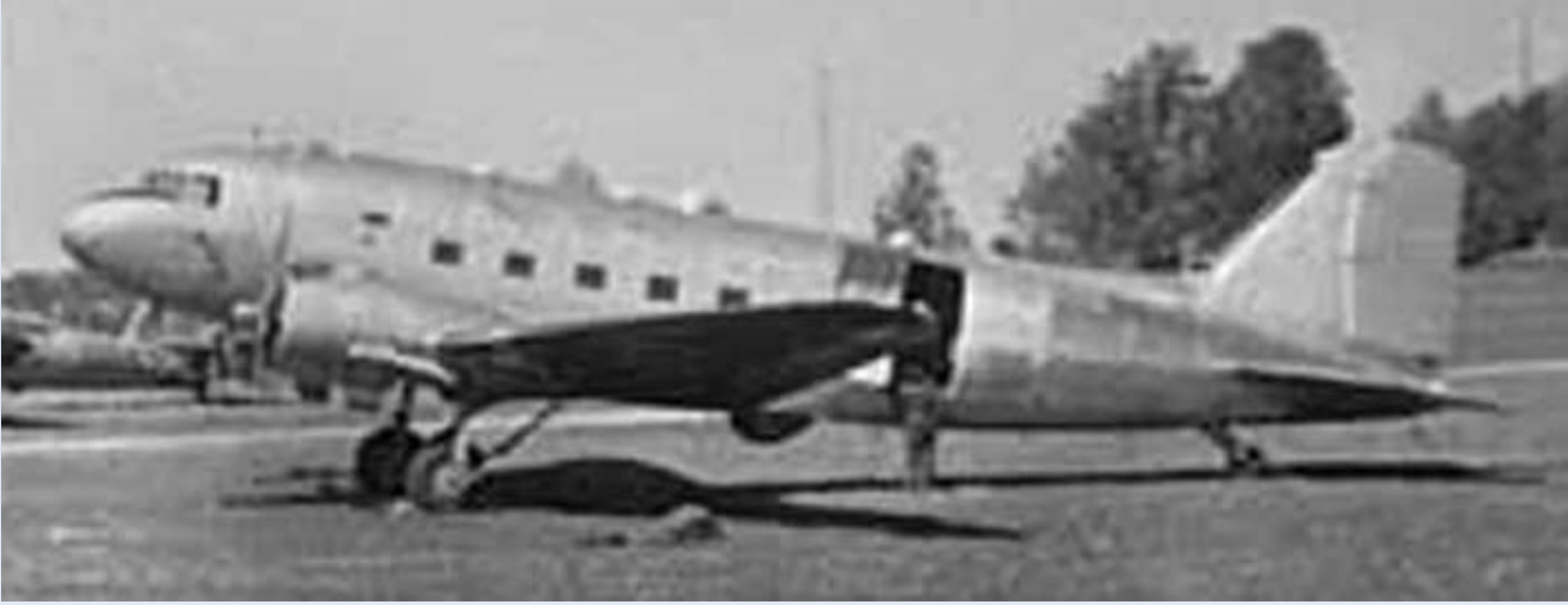
DC 3:an uppställd på F8 Barkarby

1. Den 13 juni 1952 sköts detta flygplan av typ DC-3 ned av ryskt jaktflyg öster om Gotska sandön. Flygplanet var ett transportflygplan (Tp 79) som hade utrustats för signalspaning. Flygningen var en rutinmässig signalspaningsflygning mot ryska radarstationer i Baltikum och genomfördes över internationellt vatten.