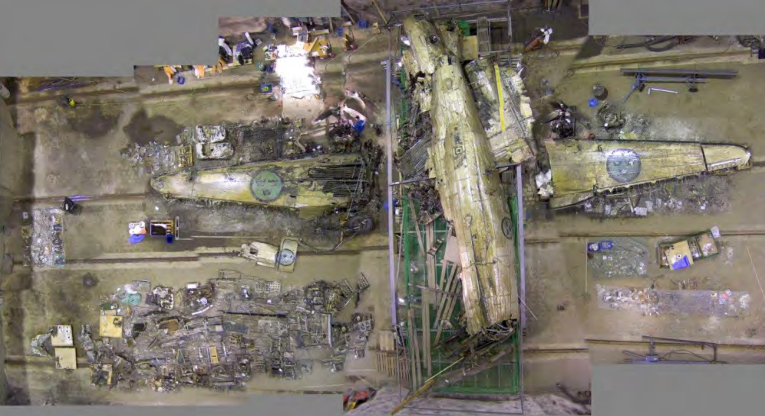
Flygplanets bärgade delar utlagda i rätt position

3. De bärgade flygplandelarna placerades ut på golvet i en torrdoca vid Musköbasen. Genom att studera vrakdelarna kunde man nu bli utreda hur projektilerna från det ryska jaktflygplanets automatkanoner hade träffat och vilken attityd flygplanet hade när det slog ned i vattnet.