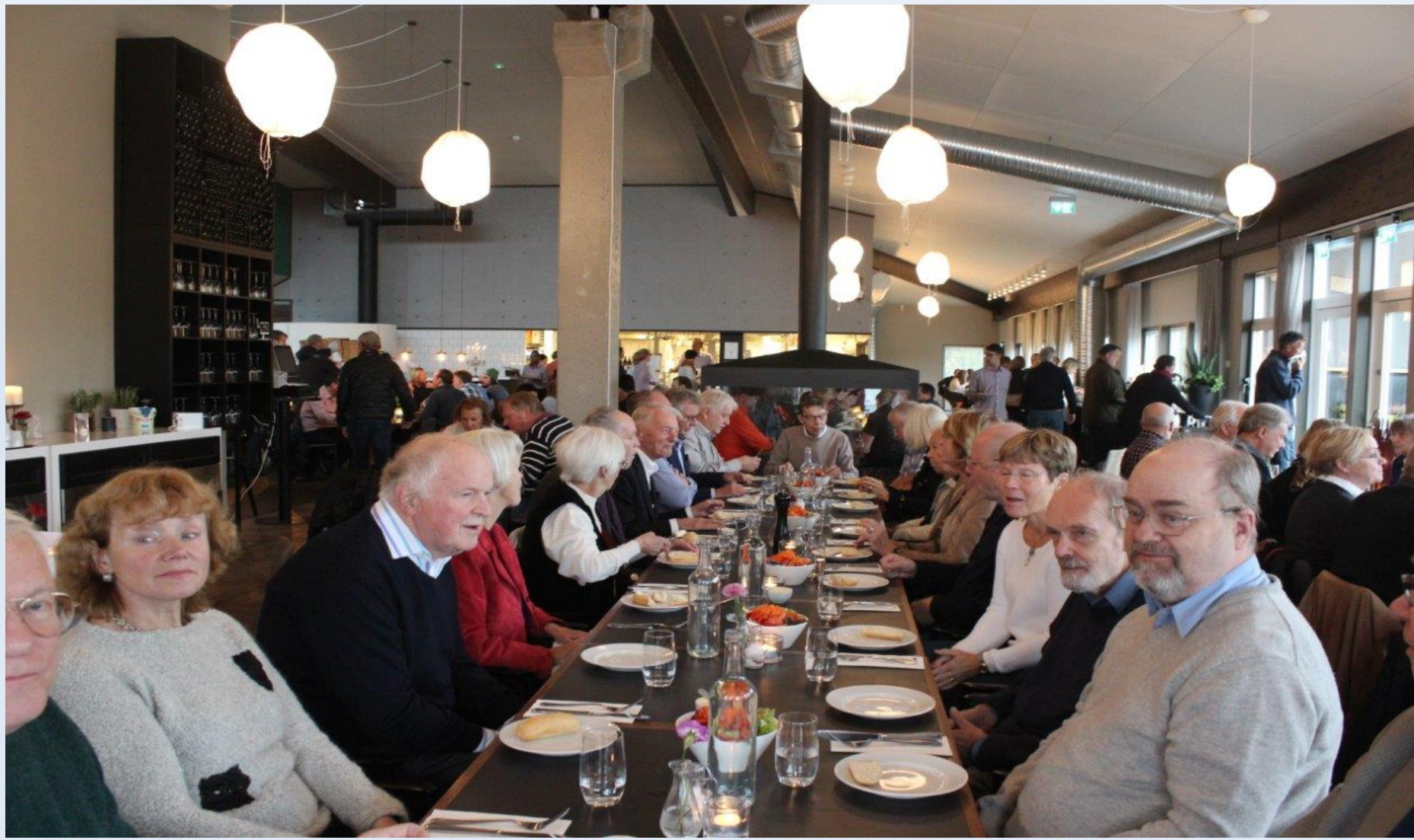
Lunch på Restaurang Saltsjö Pir

Den 19 oktober gjorde veteranklubben årets andra lunch- och studiebesök på det endast två år gamla muséet HAMN i Nacka/Fisksätra. HAMN är en förkortning av HistorieArvs Muséet i Nacka och muséet skildrar historien på den plats där det ligger vid den mer än tusen år gamla vattenvägen från Östersjön in till Stockholm, Mälaren och Birka. Vi startade med lunch och besökte därefter muséet.