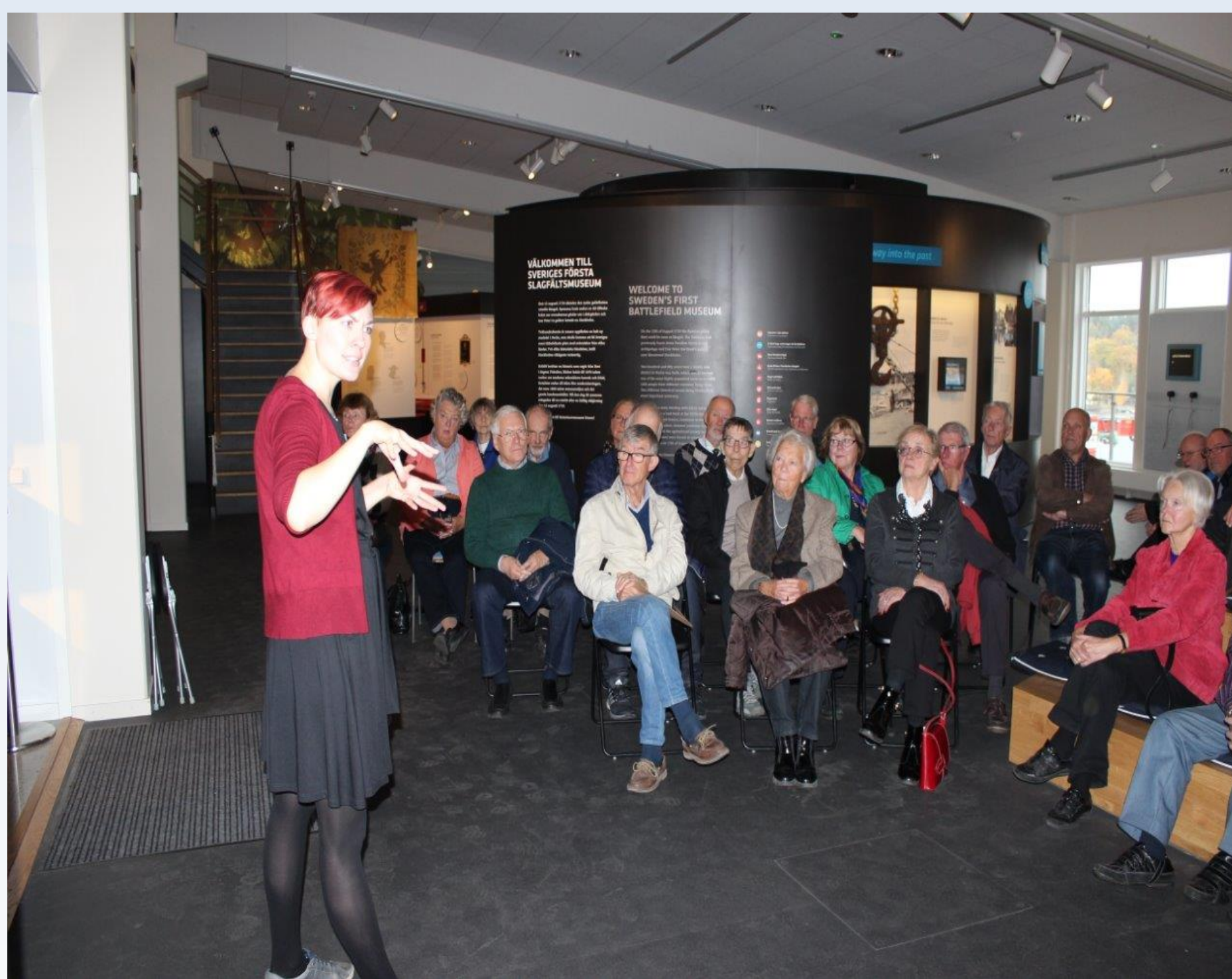
Guiden ger en första introduktion till muséet

Granne med muséet ligger slagfältet där slaget vid Stäket stod i augusti 1719 och granne på andra sidan är Fisksätra centrum.